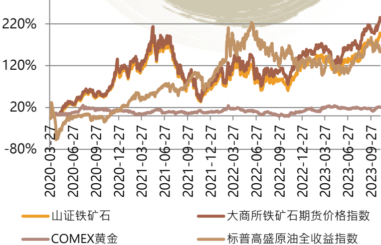
时间: 2020年3月27日至2023年11月3日