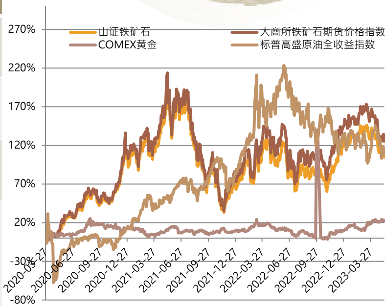
鐵礦石指數累積表現