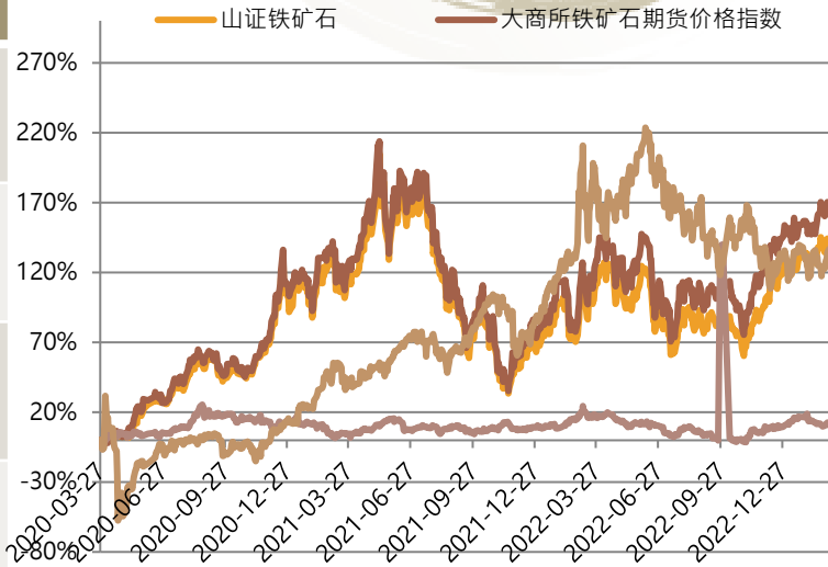
铁矿石指数表现优于其他商品类指数