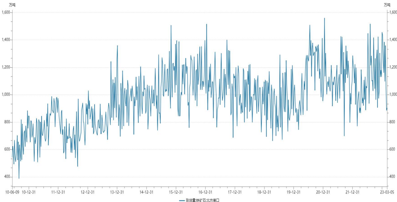
到货量:铁矿石:北方港口