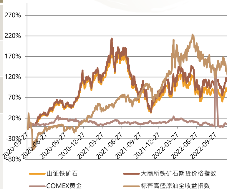
铁矿石指数表现优于其他商品类指数

时间: 2020年03月27日至2022年11月25日