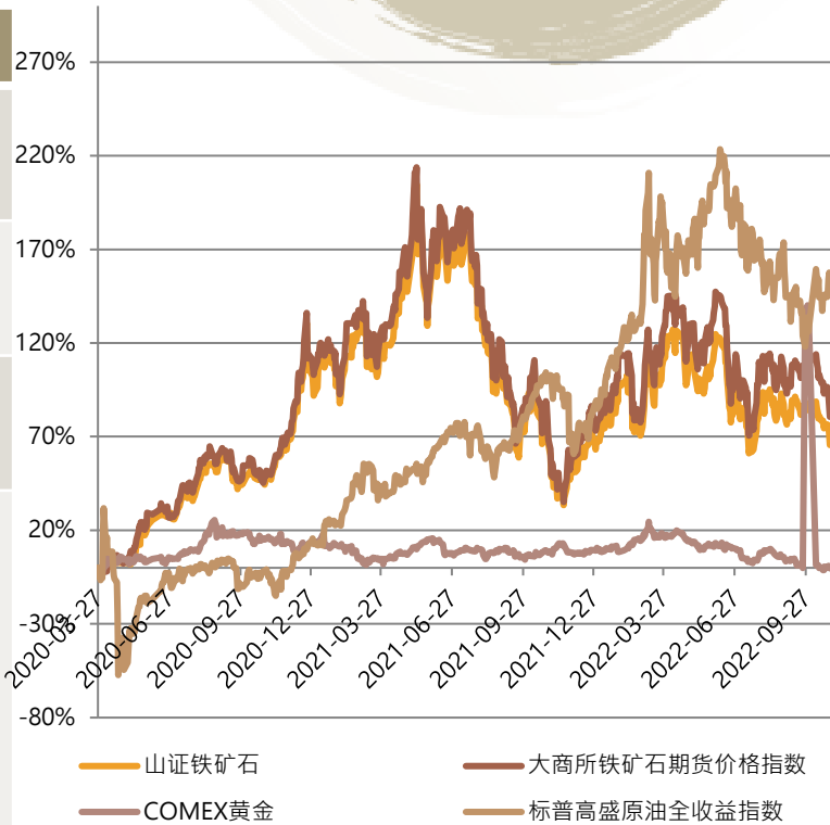
資料來源: 萬得, 山證國際 時間: 2020年03月27日 至 2022年10月28日