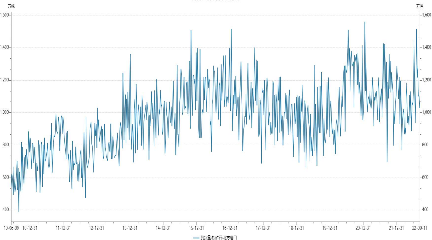
到货量:铁矿石:北方港口